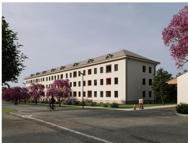
VIZUALIZACE POHLEDU Z ULICE