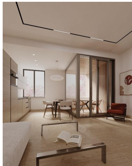
VIZUALIZACE SPOLEČENSKÉHO SÁLU