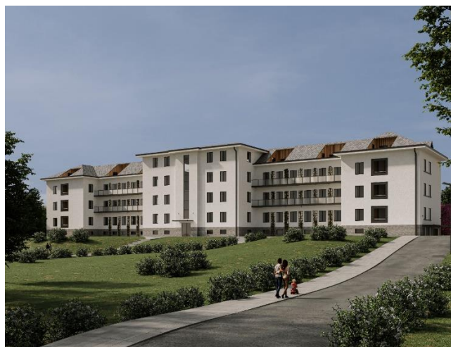
VIZUALIZACE POHLEDU OD PARKU